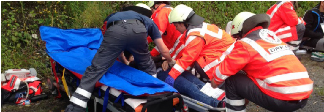
Elzer Rotkreuzler heben einen Patienten bei einer Katastrophenschutzübung auf die bereitgestellte Vakuummatratze über