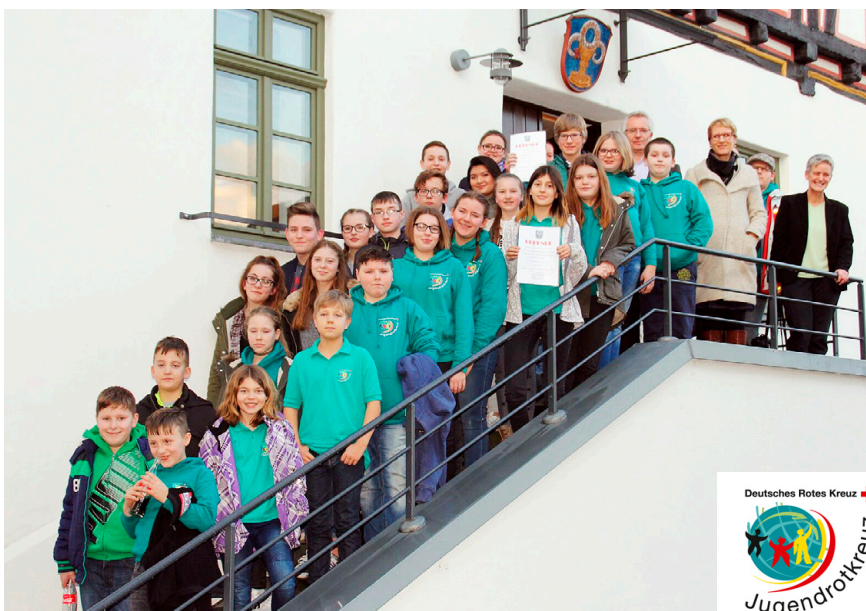
Das versammelte Team des Elzer Jugendrotkreuz vor dem historischen Elzer Rathaus.

Die Ansitzstangen stehen an der B8 am Ortsausgang von Elz in Richtung Malmeieich, im Mittelfeld und in der Grünfläche am Windpark. Der Preis ist mit 250 € dotiert und kommt direkt dem Elzer Jugendrotkreuz zu Gute.